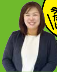
大和郡山オフィス オフィス長