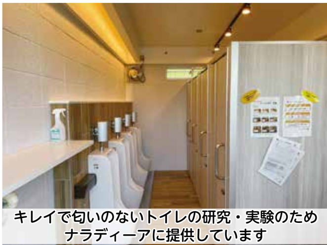
キレイで匂いのないトイレの研究・実験のため ナラディーアに提供しています